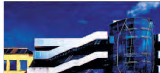
BYENS DESIGN: I lyset trer bygningenes form tydeligere frem.