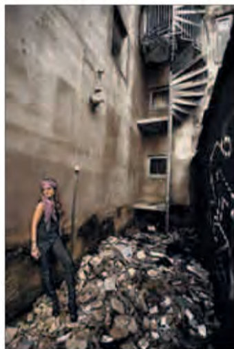
BAKGÅRDEN: Med en modell på plass kan tankefulle bilder skapes.