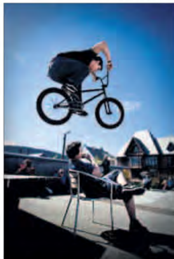
RO: Når syklistene farer over hodet, er det ikke lett å beholde roen.