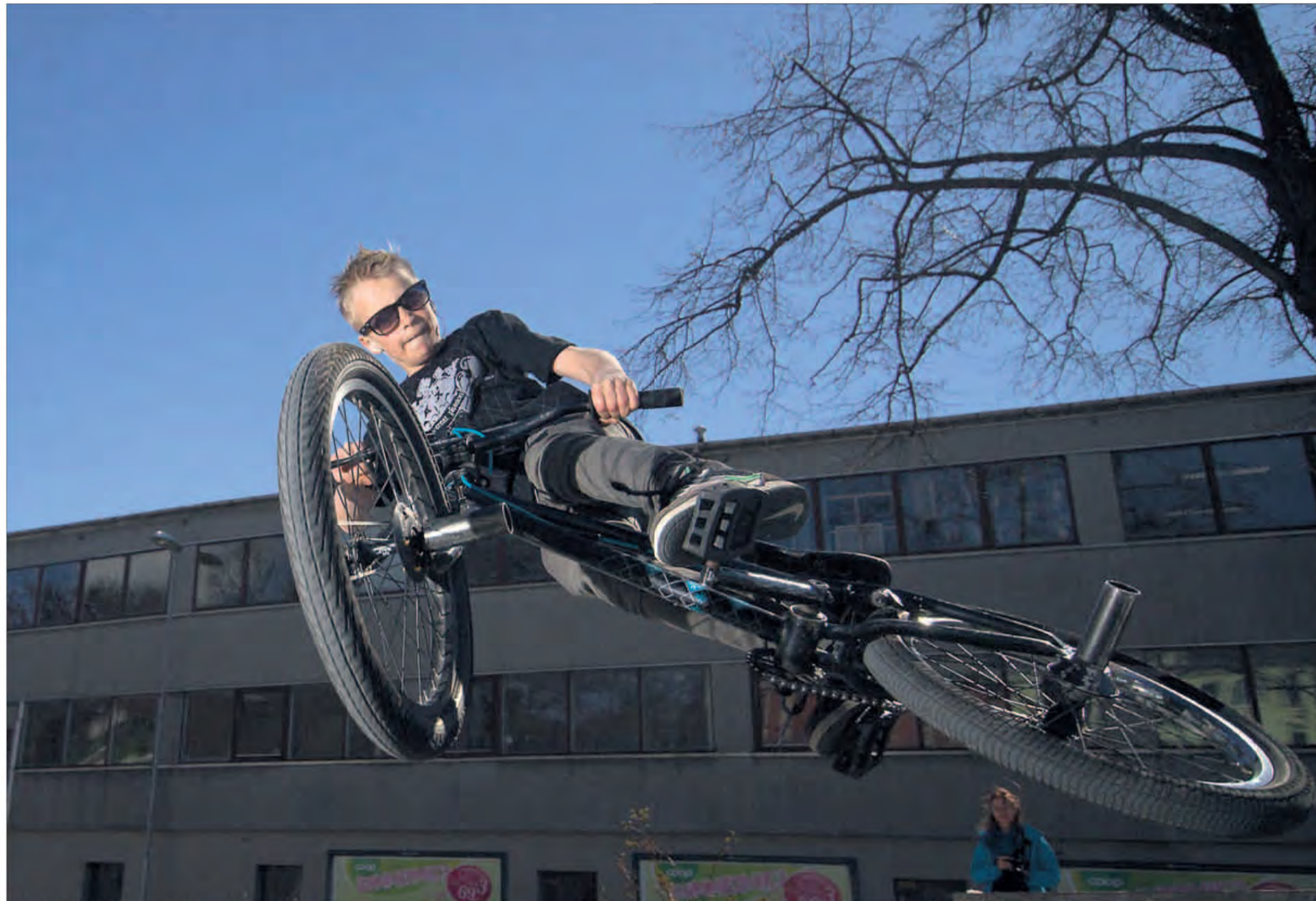
I SVEVET: Når syklistene hopper, er det hyggelig å ha et kamera i nærheten.