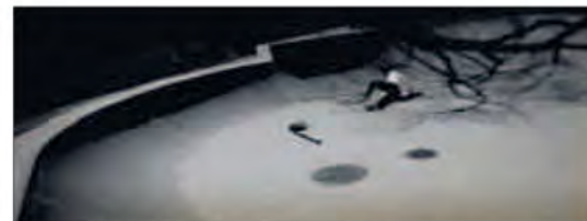
KUNSTEN Å SE: Selv skygger kan gi trolske stemninger.