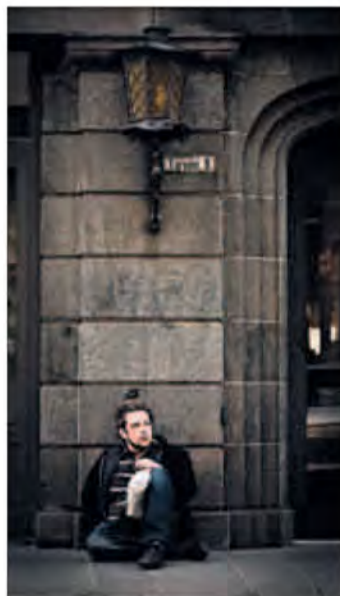
REFLEKSJON: Et fortau og en vegg å lene seg mot gir mulighet til refleksjon over de store spørsmål.