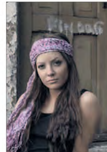
BYENS ANSIKT: Mange fulgte modellen rundt i byens gate.