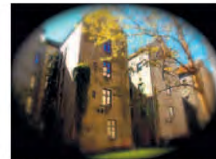
BLOMSTRING: Også ved byens bakgårder blomstrer trærne.