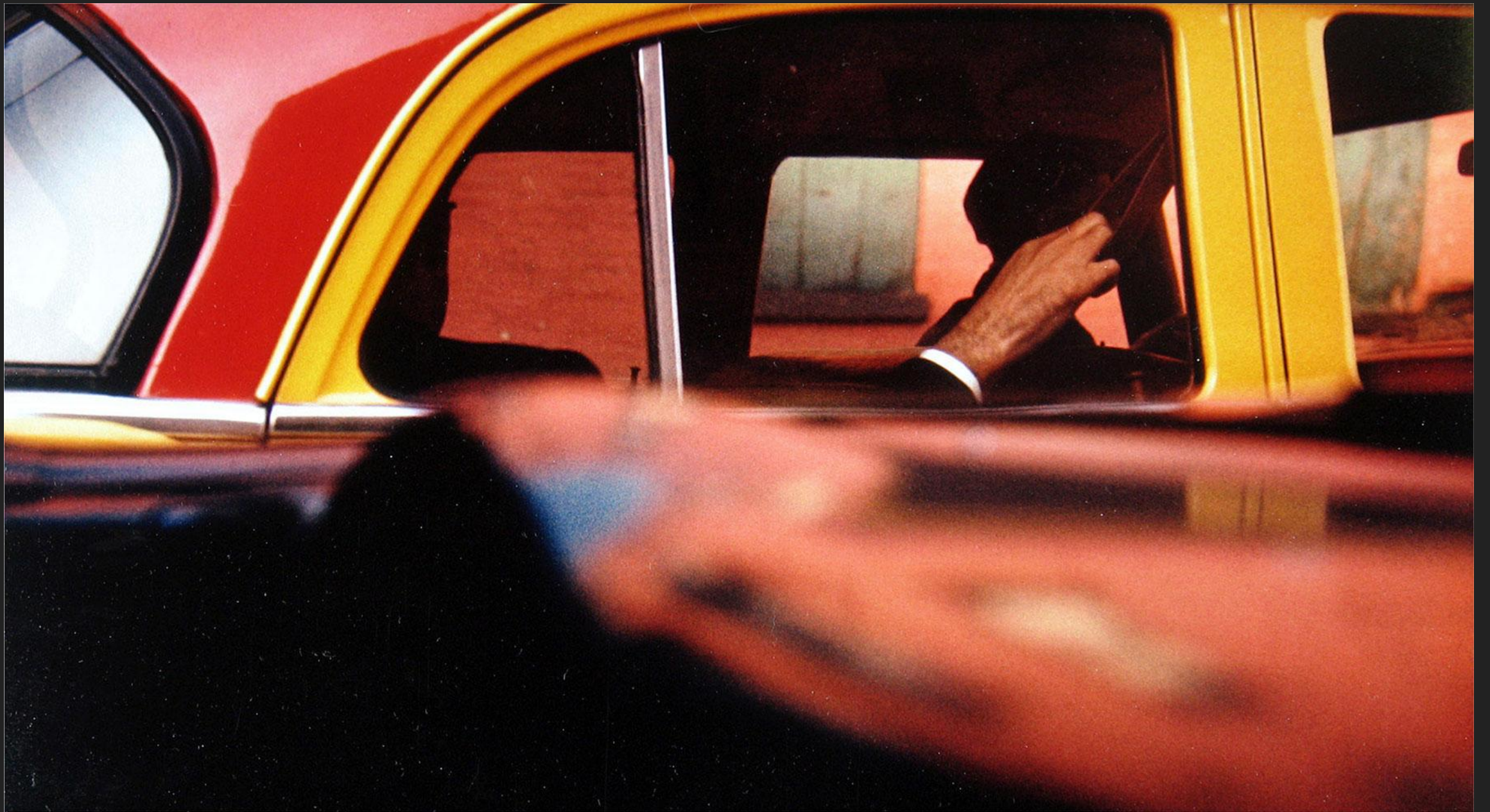
«Taxi» Saul Leiter 1957