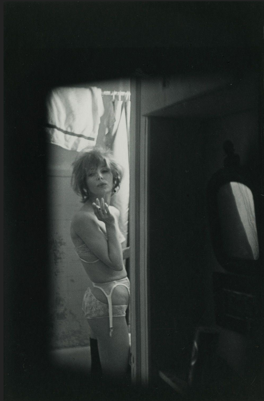
«Soames» Saul Leiter ca 1960