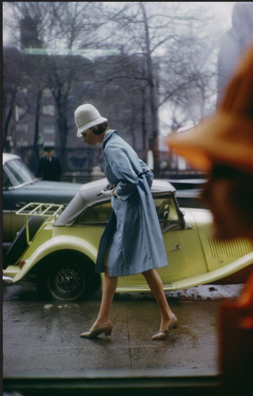
Harper's Bazaar, April 1962