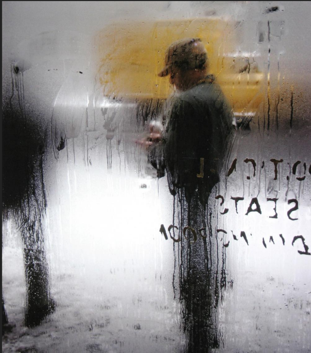
«Snow» Saul Leiter 1960