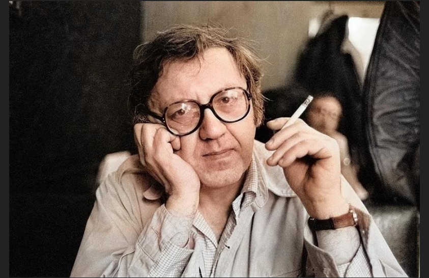
«Saul» 1977 - Alan Porter