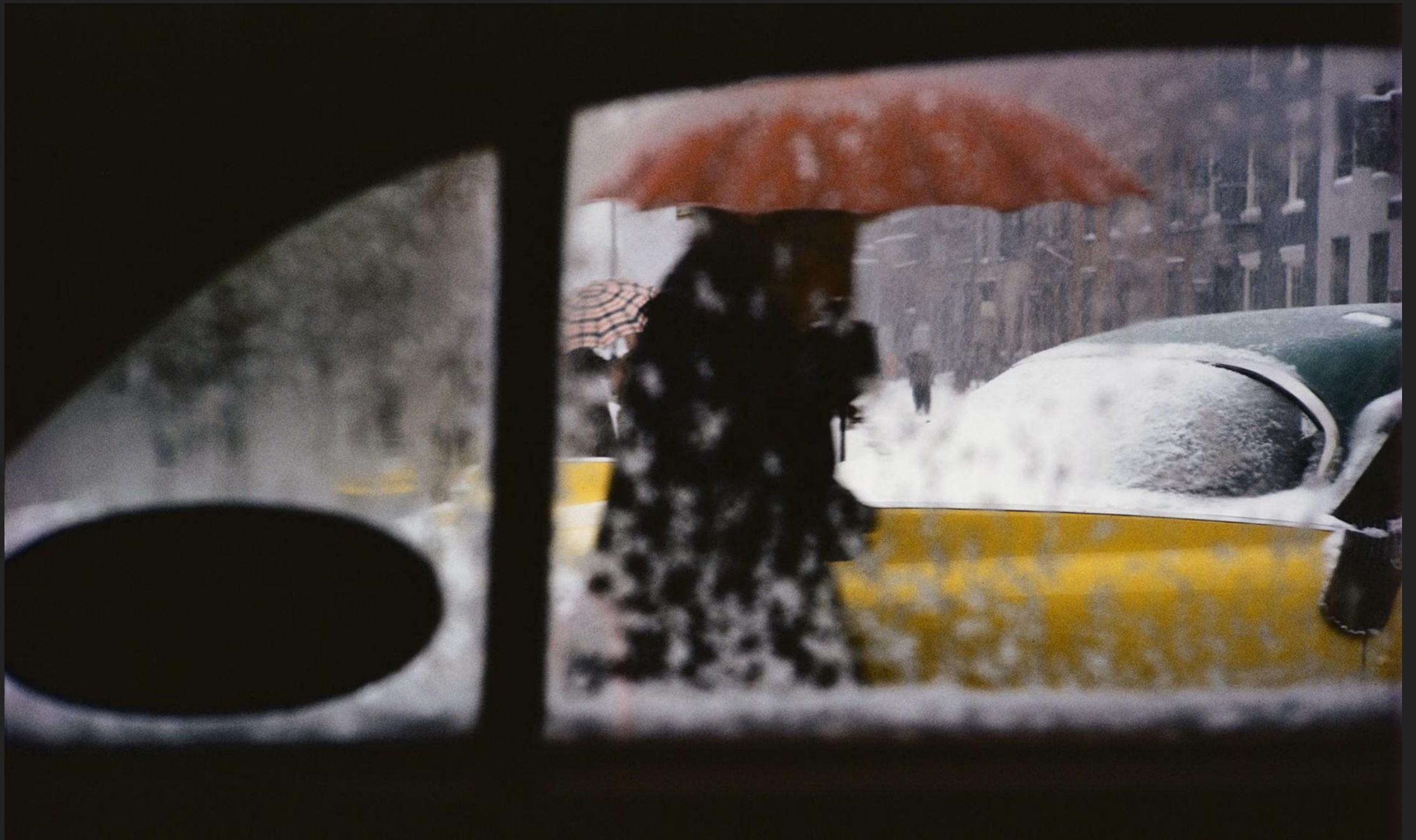
«Red Umbrella» Saul Leiter 1957