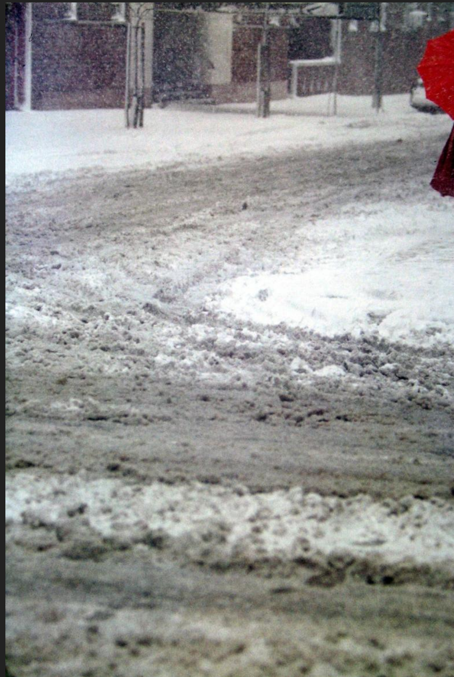
«Red Umbrella» Saul Leiter 1957