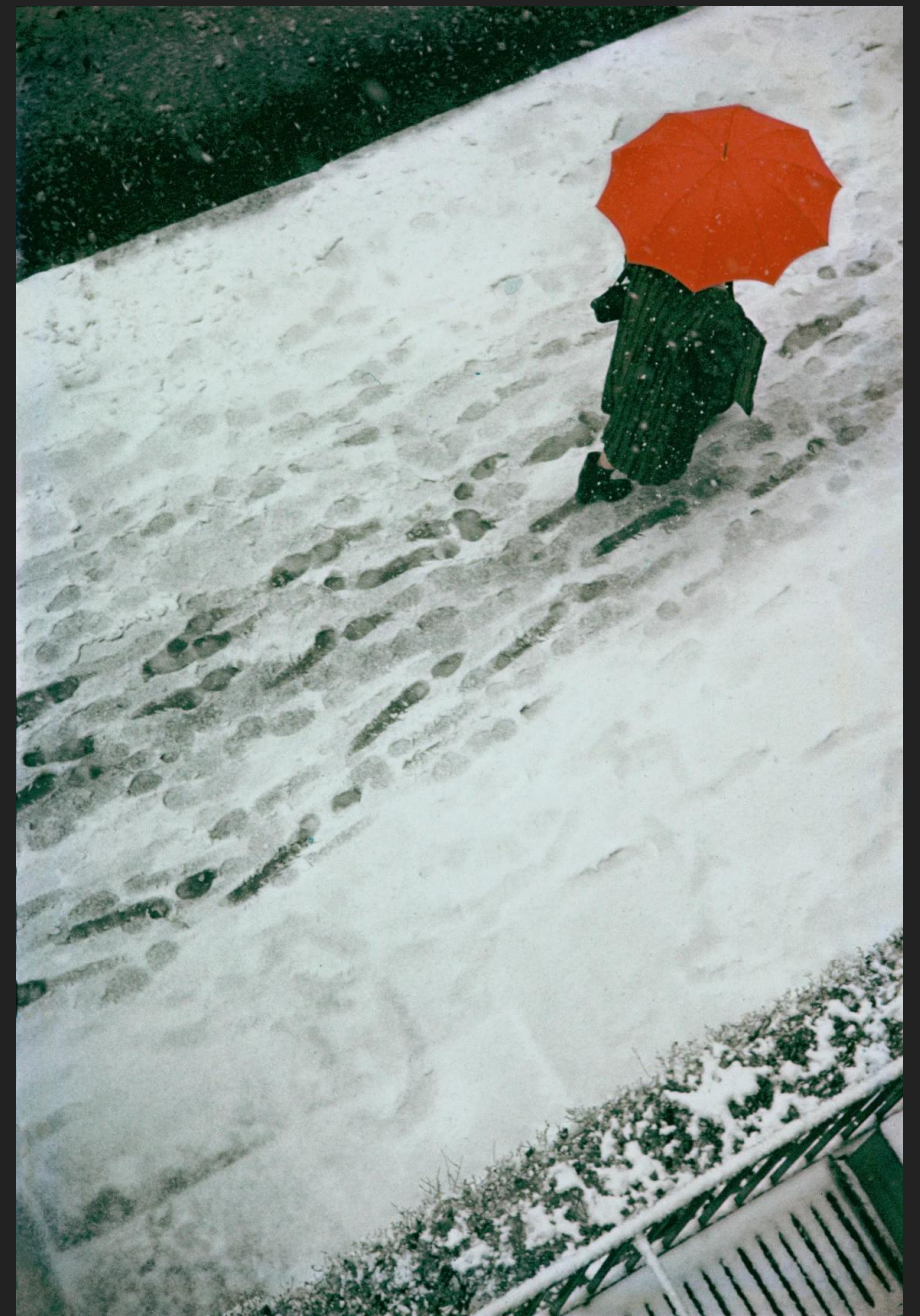
«Footprint» Saul Leiter 1957