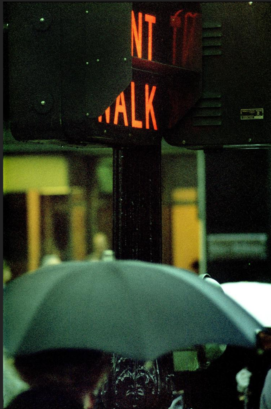
«Don't walk» Saul Leiter 1960